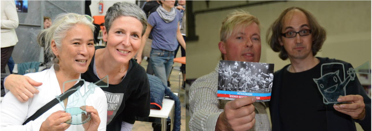
Fotos: Selina Baumgartel; links: OBRA, rechts: Wiener Beschwerdechor

OBRA gewann mit dem Projekt „One Billion Rising Vienna“, einer globalen aktionistischen Kampagne, die sich aus der V-Day-Bewegung entwickelte und mit künstlerischen Mitteln für die ernste Thematik der Gewalt an Frauen* und Mädchen* sensibilisiert und Betroffene* unterstützt. Am 14. Februar 2017 fand bereits das fünfte Rising in Wien statt, eine getanzte Kundgebung, die von Auftritten zahlreichen Künstler_innen und künstlerisch aktivistischer Gruppen begleitet wurde.